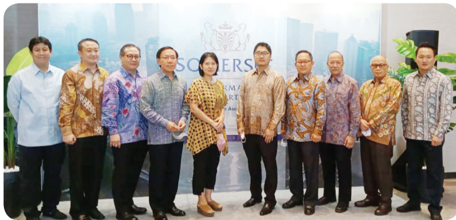
Para share holder berfoto bersama.

Sekedar informasi tambahan, di tahun 2022, properti Ascott yang akan dibuka antara lain Somerset Asia Afrika Bandung, Citadines Gatot Subroto Jakarta, Citadines Sudirman Jakarta, Shanaya Resort Malang, Fox Lite Hotel Grogol, FOX Lite Hotel Majalaya Bandung, FOX Lite Hotel Samarinda dan POP! Hotel Pekanbaru. • kris